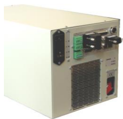
Kompaktsystem Laserdiode + Controller

Die Lasersteuerung beinhaltet das Netzteil für die Versorgung des Laserkopfes und ermöglicht die Kommunikation zum Laserkopf und zur Kühlung. Das System wird grundsätzlich über die serielle Schnittstellen RS232 sowie digitale IOs gesteuert und überwacht. Auf der Frontplatte befinden sich zusätzlich einige Bedien- und Anzeigeelemente.