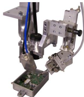
Lötkopf: Laser mit Lotvorschub